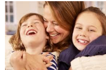
משפחה חד הורית