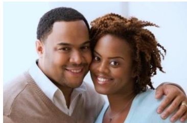
משפחה ללא ילדים