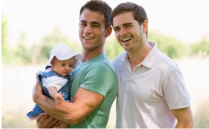
משפחה חד מינית

מרכז המחקר והחינוך לשפת העברית אוניברסיטת חיפה