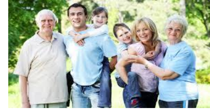
יחסים בין דוריים משפחה רב דורית